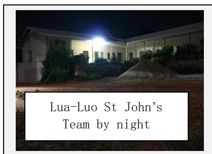
Lua-Luo St John's Team by night

The two dark nights are characterized by a loss of control and an experience of powerlessness. In these two levels of purification, the spirit of God is calling us beyond ourselves, beyond where we are, into transcendence. Many find it difficult to go this way on our own because our humanity limits us. But this is the path to personal wholeness and holiness. This is a journey to the true self. Dark Night is a sign of life, of growth and development of our relationship with God, in our best human relationships and in our societal life. It is a sign to move on in hope to a new vision and a new experience. Jesus on the cross, in his own dark night of the spirit cried out with anguish, "My God, my God why have you forsaken me?" (Mark 15:34). Just before he died, he uttered a loud cry and said "Father! In your hands I place my spirit!" (Luke 23: 46), teaching us in his last words what our disposition must be as well ; total surrender and total trust.